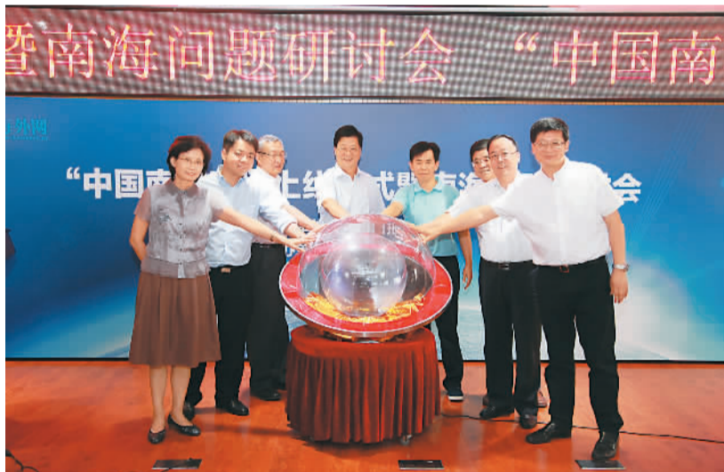
图为人民日报社编委、人民日报海外版总编辑王树成(左四)与现场嘉宾共同启动“中国南海网”上线仪式水晶球。

本报北京7月18日电 (牛宁、王少喆) 7月18日,由人民日报海外版主办、海外网承办的“中国南海网”上线仪式暨南海问题研讨会在北京举行。人民日报社编委、人民日报海外版总编辑王树成出席,人民日报海外版副总编辑王咏斌、中国人民解放军国防大学教授戴旭分别致辞。 “中国南海网”是人民日报海外版、海外网“报网融合”的最新举措,集知识性、资料性、专业性于一身。网站首页设立“南海观察”“最新资讯”两个