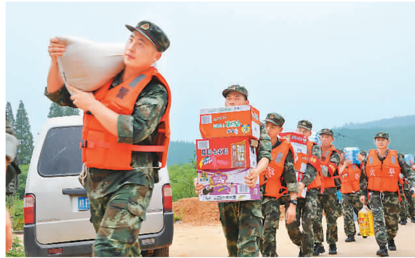
7月11日，在安徽宣城抗洪一线的武警安徽总队第一支队官兵，利用休息时间来到宣城市宣州区养贤乡敬老院安置点看望老人和受灾群众，并为他们带去了食物、药品和慰问金。