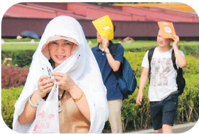
7月10日，北京长安街头的游客采取各种方式遮阳防暑。

“躺在床上是红烧，铺上席子是铁板烧”……在微博、微信朋友圈里，这样的段子并不少见，而它们所调侃的就是全国部分地区最近的高温天气。