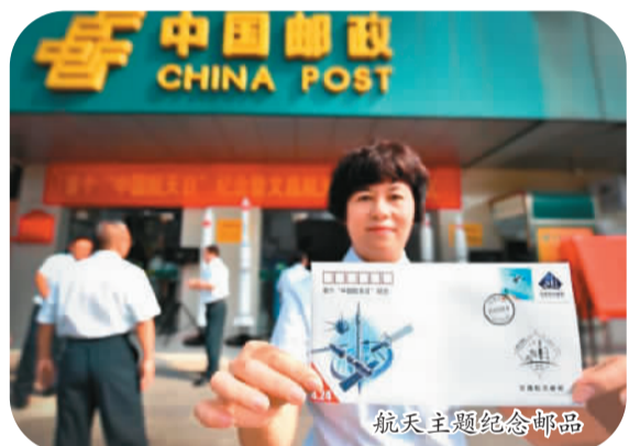
航天主题纪念邮品

另一个有特色之处在于，在文昌发射场的规划中，从一开始就设计了系统的游客参观游览路线，