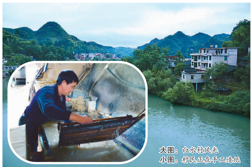
大图：白水村风光 小图：村民正在手工造纸

“百闻不如一见”。伴随着岑巩县旅游宣传力度的加大，古法造纸技艺已成为该县宣传推介地方特色文化的又一张名片，推动着白水村一带文旅产业融合发展。据村民介绍，每年的春、夏、秋三个季节，前来龙鳌河沿岸休闲度假的游客络绎不绝。