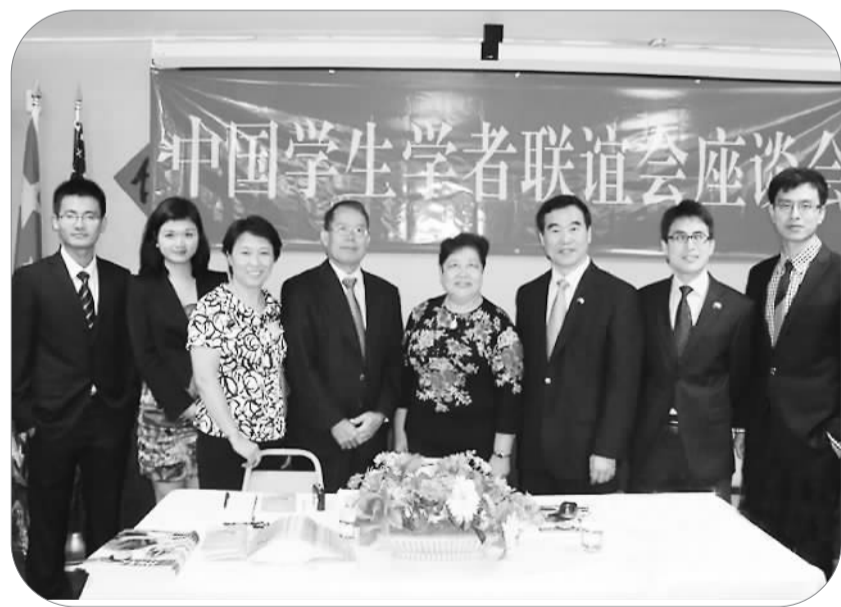
本文作者(左四)出席中国留学生学者联谊会座谈会。