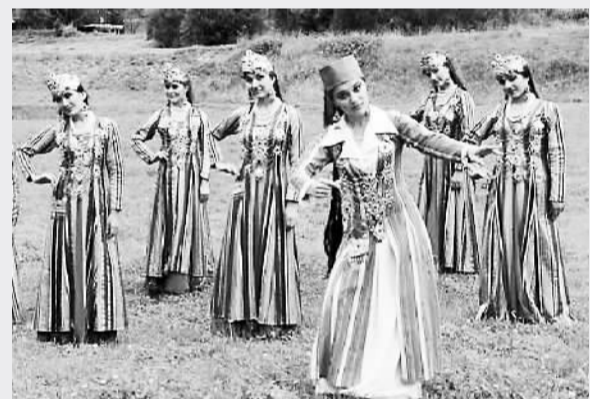
乌兹别克斯坦女子在表演民间传统舞蹈。