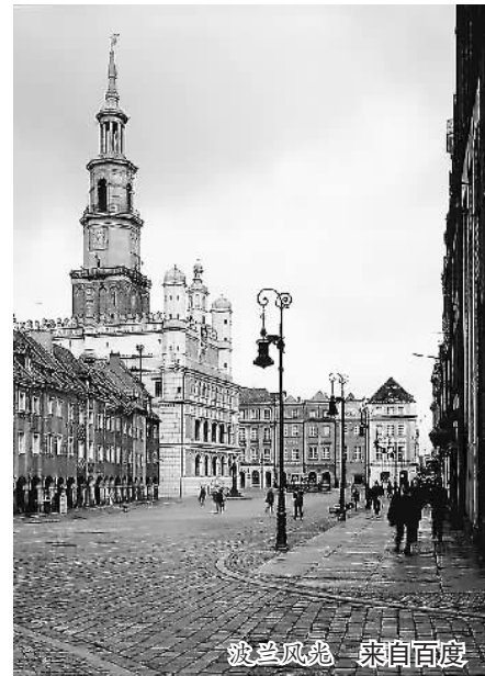
波兰风光

业内评价,中国已视中东欧国家为旅游合作的重要伙伴,愿意在中国—中东欧国家合作机制框架下,全面展开旅游领域的务实合作。相关专家表示,“16+1”框架下的旅游合作有利于把中欧旅游合作从西欧、南欧、北欧和俄罗斯向中东欧扩展,将进一步完善中国旅游开放的格局,更好地发挥旅游交流在国家外交中的重要作用。