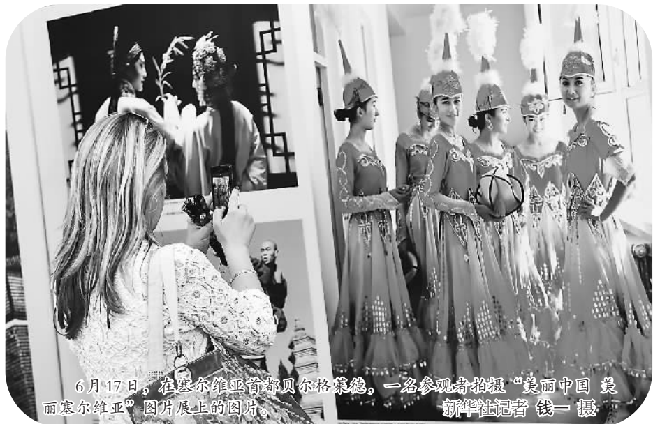
6月17日,在塞尔维亚首都贝尔格莱德,一名参观者拍摄“美丽中国 美丽塞尔维亚”图片展上的图片。

6月17日至24日,国家主席习近平对塞尔维亚、波兰和乌兹别克斯坦进行国事访问。中塞两国关于建立全面战略伙伴关系的联合声明指出,双方愿继续加强在旅游等人文领域的交流合作,两国愿为双方公民赴对方国家旅游提供更多的便利措施。中方赞赏塞方愿积极考虑给予持普通护照的中国公民免签证待遇,塞方愿尽快研究出台相关具体政策。中波两国达成多项重要共识,双方同意全面推动人文领域交往,加强旅游合作。