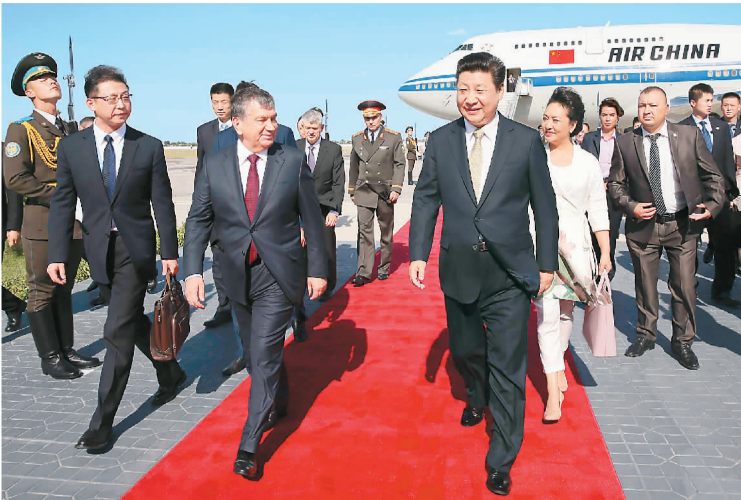
图为在布哈拉国际机场,习近平和夫人彭丽媛受到乌兹别克斯坦总理米尔济约耶夫和布哈拉州州长埃萨诺夫等热情迎接。