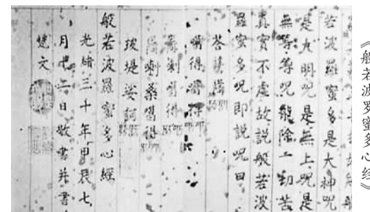
慈禧朱笔抄写的《般若波罗蜜多心经》

那么，慈禧书法的真实水平究竟如何呢？北京故宫博物院现藏有一件慈禧用朱砂抄写的《般若波罗蜜多心经》，落款为光绪三十年（1904年）。因抄写佛经须本人亲为才见诚意，方能功德、得福报，故慈禧应该不会让人代笔。观此经文，笔力孱弱稚嫩，结字松散呆滞，毫无生气，尚属初学水平，与“复殿留景”相去不可以道里计。