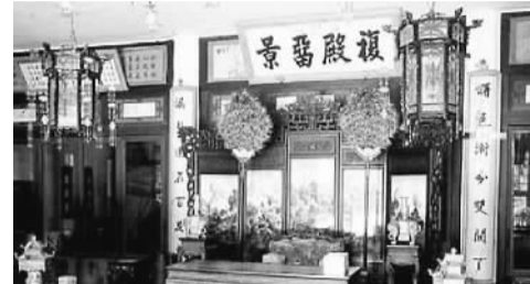
颐和园玉澜堂“复殿留景”匾额

在北京颐和园昆明湖畔，有一座清代皇帝的书堂——玉澜堂。光绪年间，玉澜堂成了光绪皇帝的寝宫，1898年戊戌变法失败后，慈禧太后曾把光绪帝幽禁在这里。每年的4月初到10月，慈禧太后都要在颐和园住上7个月，其间光绪帝也必须随同前往，困居在玉澜堂里。为了防止光绪帝与外界接触，慈禧就命人在玉澜堂的前后左右修砌了多道砖墙，门口还有太监站岗，将玉澜堂全面封闭起来，清雅宜人的书堂从此成了一代帝王凄苦寂寥的牢笼。至今人们来到玉澜堂，似乎仍能感到一股阴森森的气息弥漫其中。