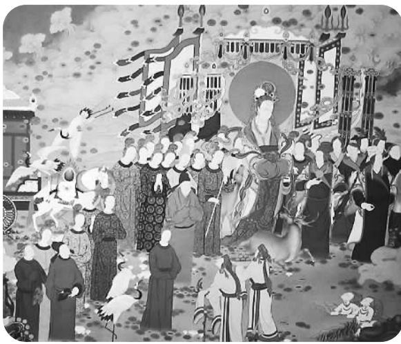
唐卡作品《文成公主进藏图》(局部)

唐卡是积累了千百年的生活智慧和艺术经验形成的藏传佛教重要文化产品，在藏区形成了不同风格的画