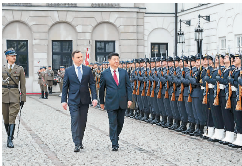
6月20日,国家主席习近平出席波兰总统杜达在华沙总统府举行的隆重欢迎仪式。