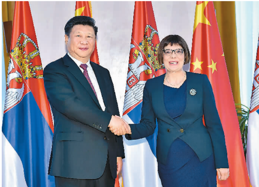
6月18日,国家主席习近平在贝尔格莱德会见塞尔维亚国民议会议长戈伊科维奇。