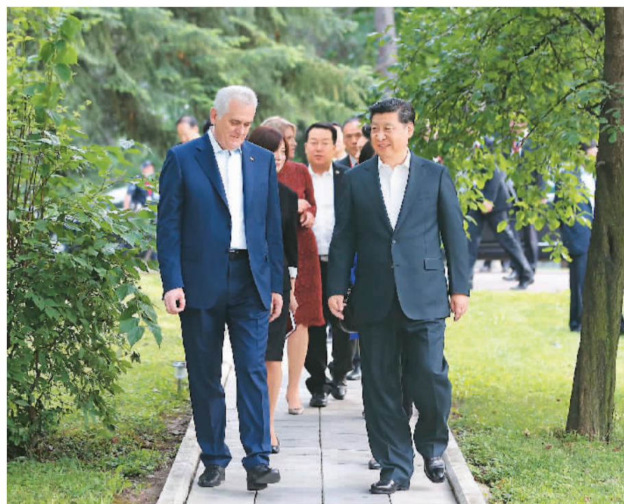
当地时间6月17日,国家主席习近平同塞尔维亚总统尼科利奇在贝尔格莱德举行会晤。