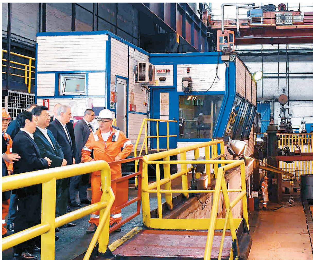
6月19日上午,国家主席习近平在贝尔格莱德参观河钢集团塞尔维亚斯梅代雷沃钢厂。