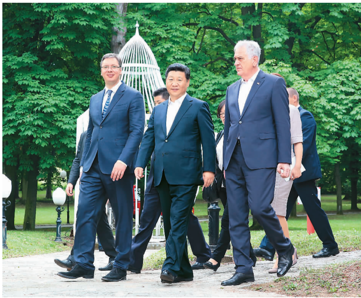
6月19日,国家主席习近平在贝尔格莱德出席塞尔维亚总统尼科利奇、总理武契奇共同举行的午餐。