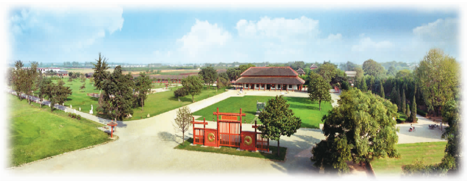
▲河南安阳殷墟宫殿宗庙遗址 ▼殷墟博物馆俯瞰

殷墟是中国商朝晚期的都城遗址，是中国历史上第一个有文献可考并为考古学和甲骨文所证实的都城遗址，位于河南省安阳市西北郊一带，横跨洹河两岸，保护区面积36平方公里。