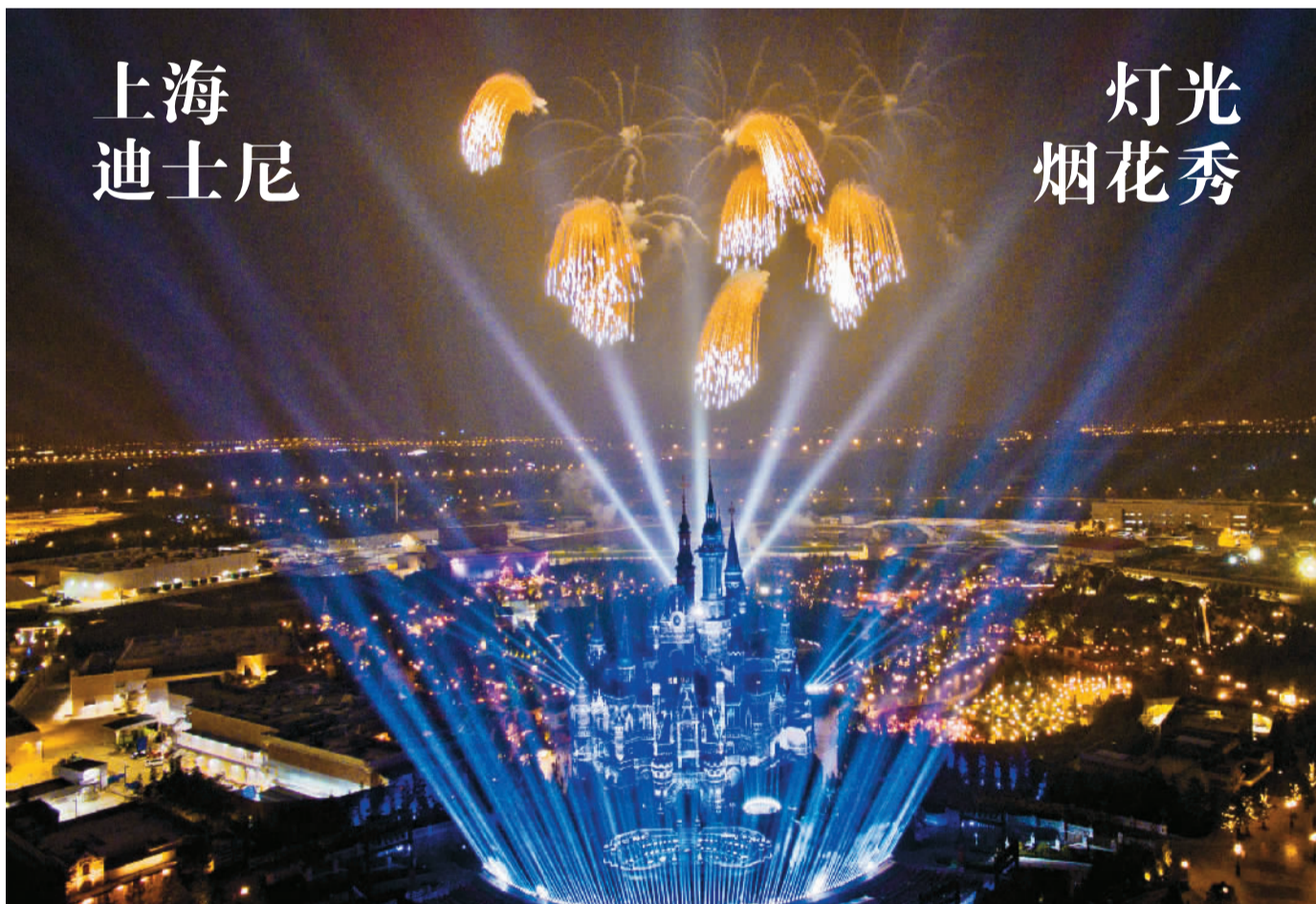
上海迪士尼乐园将于6月16日正式开园。从6月14日起,上海迪士尼举行为期3天的开幕庆典活动。图为上海迪士尼乐园奇幻童话城堡“灯光烟花秀”彩排现场。

6月14日,由中国国务院新闻办公室、中国驻波兰大使馆主办,中国外文局人民画报社和波兰国家公民协会承办的“美丽中国·美丽波兰”图片展开幕式在波兰首都华沙举行。