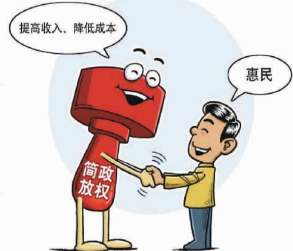
惠民 程硕作(新华社发)

在谈及降低企业成本与企业创新的关系时，中国人民大学经济学院谢富胜教授指出：“从当代发达国家创新的过程来看，当前国内实体企业要想获得市场竞争优势，关键在于持续地进行产品创新，适应信息技术发展进行组织创新；在于提高自身有效供给的能力；在于提供高质量多样化产品的同时降低运营成本。”所以，谢富胜认为，各地政府实施“降成本”的具体政策时，必须精准有效，在降低制度性交易成本、清理不合理收费的同时，防止新的产能过剩；同时，在减轻实体经济负担的时候，切记不能忘记去产能的目标。