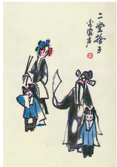
李滨声画 樊明君文