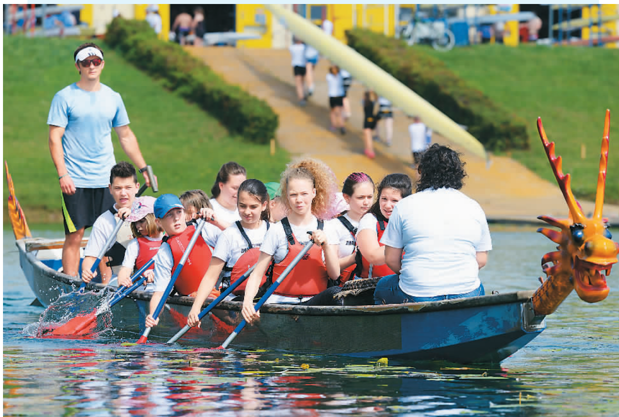
6月11日，克罗地亚萨格勒布大学孔子学院在雅伦湖组织龙舟赛，与当地民众共度端午节，共有10支龙舟队参加比赛。图为萨格勒布市民参加龙舟赛。