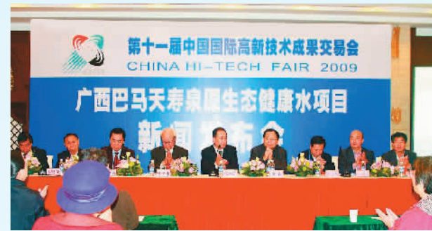
广西巴马天泉原生态健康水项目新闻发布会

此外，万家福还开展了绿色健康世界行活动，宣传和普及绿色环保知识，树立绿色富国、绿色惠民的新观念。活动得到了当地政府和民众的响应。绿色环保理念的推广与事业拓展紧密锣鼓，在业内外引起反响。