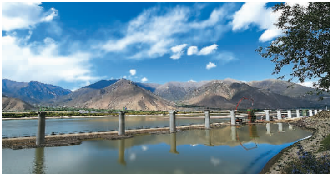
6月2日，由中国中铁五局承建的西藏拉萨至林芝铁路明则特大桥在雅鲁藏布江水中的44个墩台施工完成，至此大桥105个墩台全部完工。图为建设中的明则特大桥。