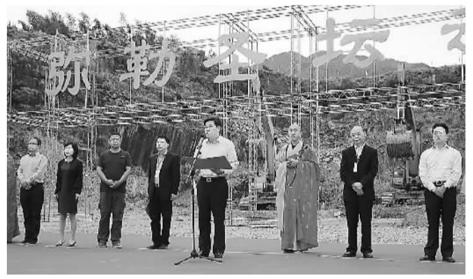
奉化举办雪窦山“弥勒圣坛”奠基仪式。

据介绍，雪窦山佛教名山建设将恢复、新建“永平寺”、“资福寺”等一批寺庙，新建弥勒圣坛、浙江佛学院新校区等建筑，共包含三大类、52个项目。空间布局为“一核一带两组团”，“一核”为中雪窦核，“一带”为朝觐带，“两组团”为上雪窦组团和下雪窦组团，进一步明确了将雪窦山建设成为弥勒信仰弘法中心、弥勒信仰朝觐中心和弥勒文化研究中心，确立中国五大佛教名山之一，弥勒根本道场地位。