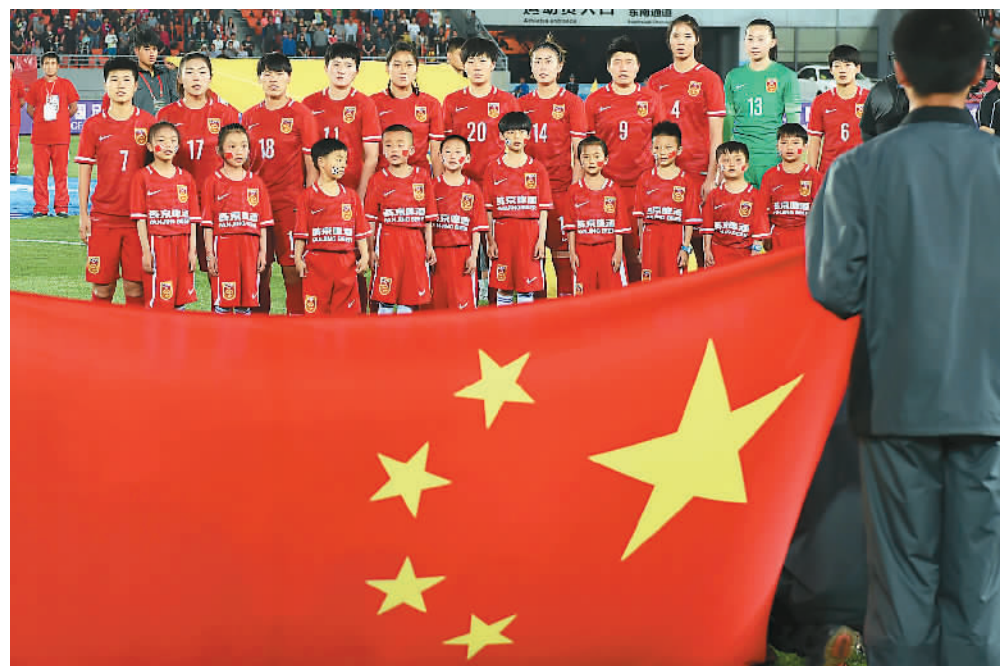
图为4月11日,中国女足队员在比赛前唱国歌。