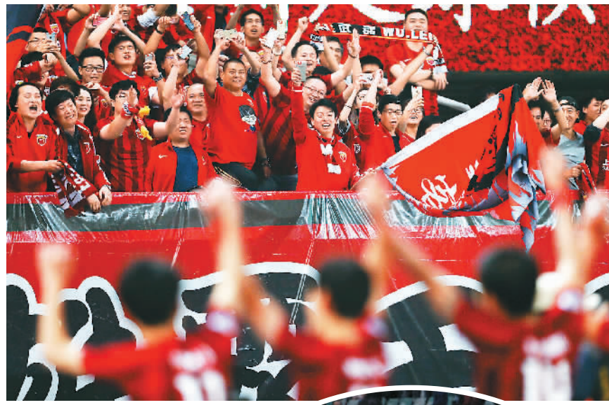
上图:5月24日,上海上港队球迷与球员在赛后庆祝。