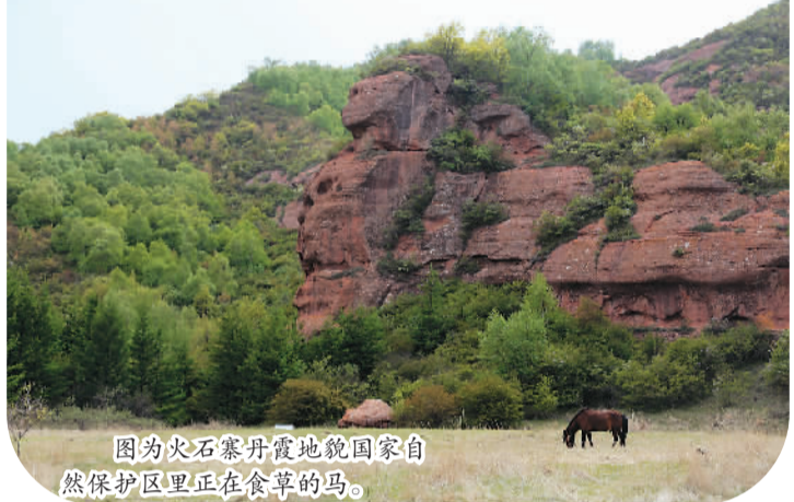
图为火石寨丹霞地貌国家自然保护区里正在食草的马