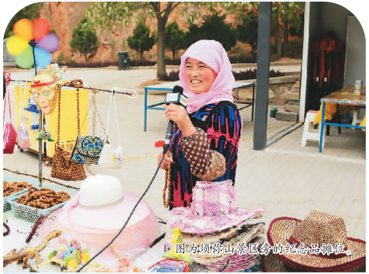
图为须弥山景区的纪念品摊位