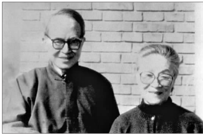
和丈夫钱钟书在北京南沙沟家中合影。

入基金，已经2000万了。而杨先生的居所却依然老旧，但先生拒绝清华大学为她重新装修。有一次，同事看到杨先生穿了一双很别致的鞋，问起缘故，先生说是已逝世多年的爱女钱媛的……”回忆起与杨绛有关的细节，人民文学出版社编辑赵萍感慨不已。