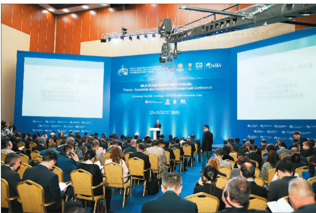
5月25日，博鳌亚洲论坛资源能源与可持续发展会议暨丝绸之路国家论坛在哈萨克斯坦首都阿斯塔纳举行，这是博鳌论坛首次在中亚地区举办会议。图为论坛现场。