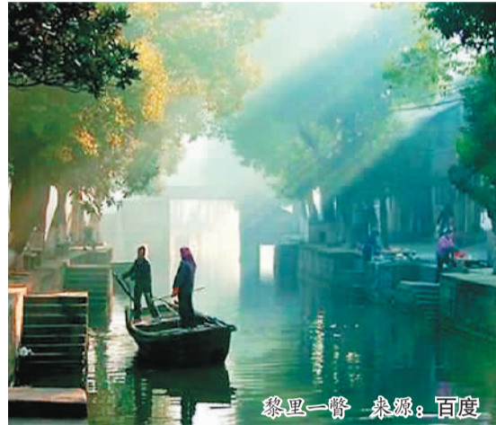
黎里一瞥

仿佛能看透小镇每个人的心思。依桥而望，读心的古弄，幽怨的窗棂，远眺的屋檐，杨柳摇曳，一幅纯美的江南水墨画铺展在眼前。市河的桥，仿如一位位老者，述说着历史，倾听着未来，沉淀了远古的文化，承载着黎里的智慧。