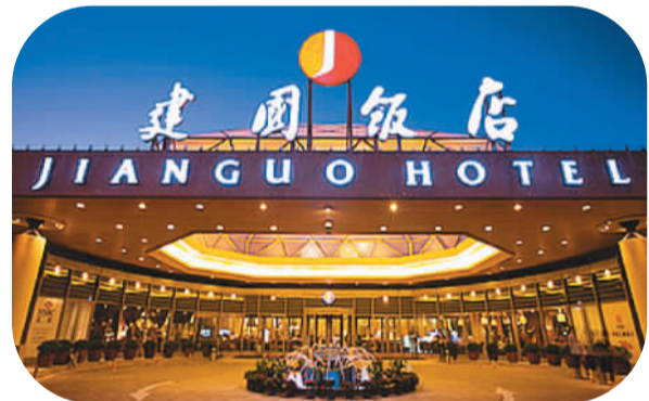
北京建国饭店是新中国第一家中外合资饭店

资金的不足，同时引进了先进的旅游接待设施和现代化的管理方法，使中国旅游业在“软件”和“硬件”方面均取得了长足的发展。