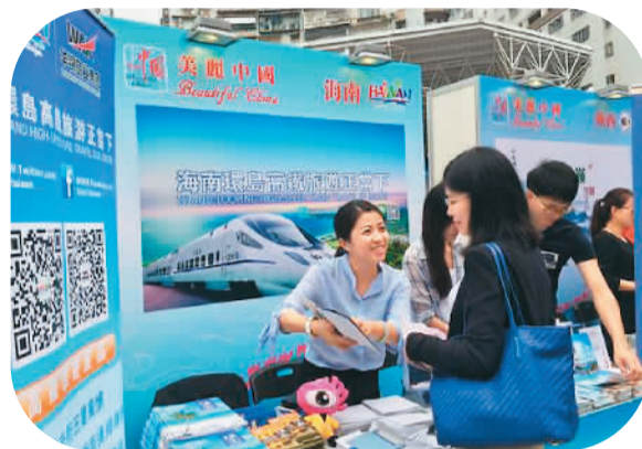
旅游业是海南省服务贸易的两大支柱之一

2013年《中国（上海）自由贸易试验区总体方案》允许在试验区内注册的符合条件的中外合资旅行社从事除台湾地区以外的出境旅游业务。