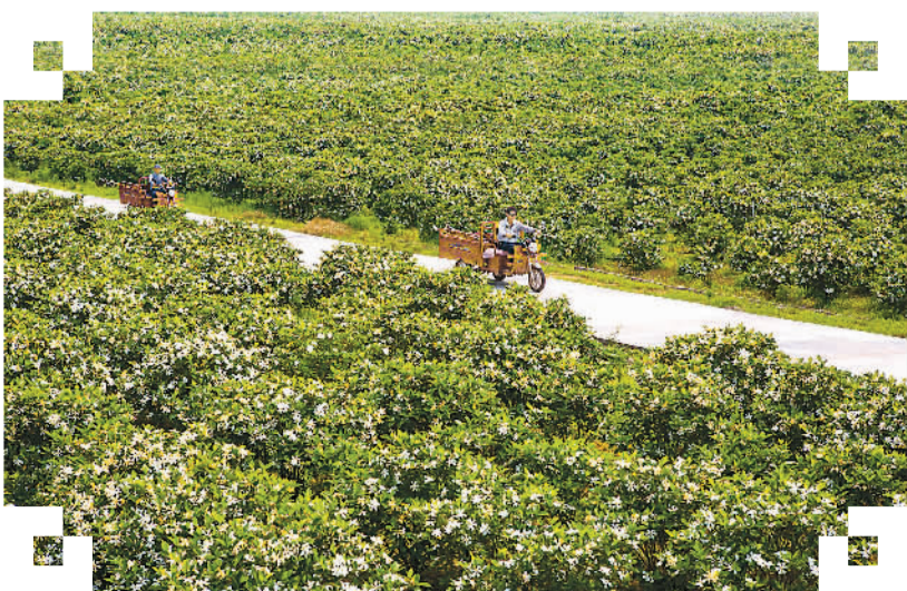
人们在栀子花海中穿行

已是5月，栀子花开得正盛。我们一家来到清江集镇，在当地人指引下，沿着一条不太宽阔的林荫道前行。道路两旁青翠逼人，让人神清气爽。转过一座小山后，眼前一下变得开阔起来。妻子突然叫道：“哟，怎么这样香啊！”我放眼望去，不远处尽是栀子