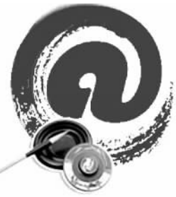
“互联网+传统文化”系列报道之⑥

民俗在创新发展的同时，仍需坚守。林继富从三方面总结了民俗的核心魅力：“首先是精神内核，互联网加速了民俗的变化，但精神内核应该被传承；其次是情感，民俗都是在情感基础上诞生的，同时也在强化和延续着这种情感关系；再次是认同功能，民俗背后是共同体的关系，身份文化的功能不应该被散失。”