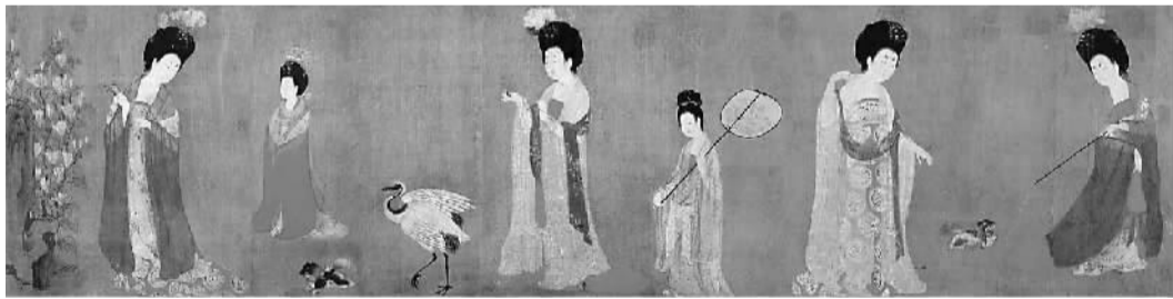
《簪花仕女图》无款 旧题周昉 辽宁省博物馆藏

一。唐代是仕女画的繁荣阶段。唐以前人物画多绘历史宗教人物，用以道德教化；随着经济发展、社会开放以及审美变迁，唐代绘画中的女性