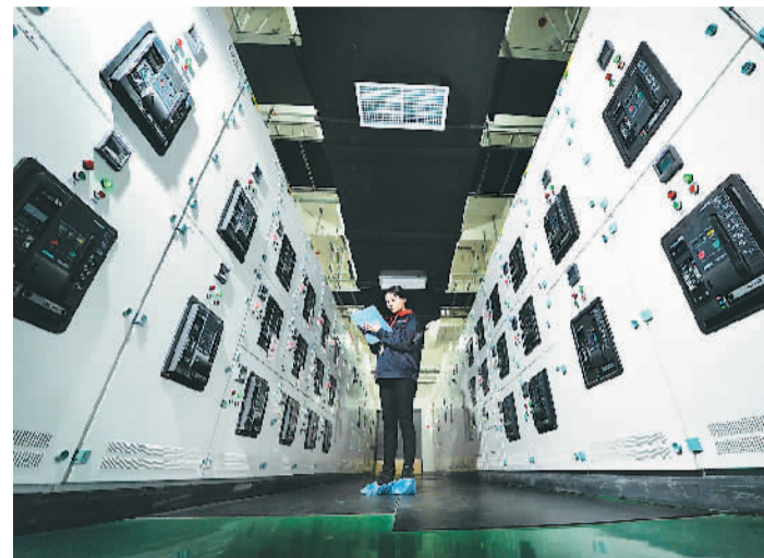
中国联通西安数据中心

据统计，本届丝博会西咸新区共推介项目总额为3224亿元，涉及十二大类项目。其中高新技术类项目24个，投资额共计525亿元，现代服务业项目19个，投资额共计586亿元，仅这两项就占投资总额34.5%，充分符合打造新兴产业和现代服务业聚集区高地的发展目标。