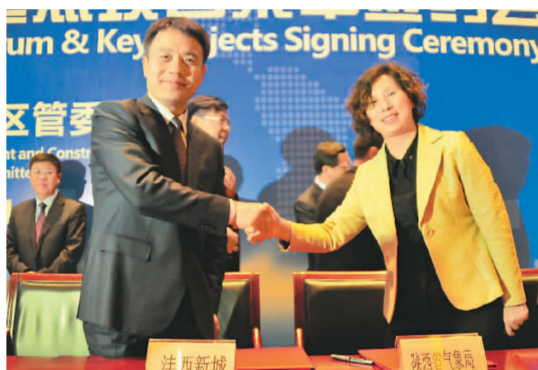
在西咸新区重点项目集中签约会上，沣西新城与陕西省气象局签约。

其中，以西咸新区信息产业园作为抓手，明确了从陕西信息服务产业基地、陕西信息研发生产基地到国家级信息产业园的“三步走”战略。目前，西咸新区信息产业园已聚集了微软、中国联通、中国电信、中国移动、广电网络等运营商，九州通医药电子商务产业园、宇培电子商务运营中心等一批优质项目，吸引了未来国际、巅峰软件