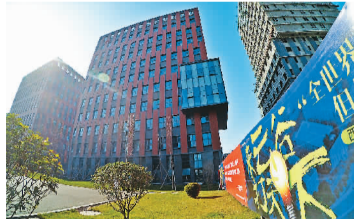
沣西新城——西部云谷

本届丝博会暨西洽会，秦汉新城以近150亿元的丰硕成果圆满收官，迈入产业发展新里程。秦汉新城设置的互动区域VR(虚拟现实)成为了本届展会的一大亮点，展位前吸引了大批观众和媒体的眼球。据介绍，秦汉新城丝路数字文化VR体验区通过三台VR设备来让客户亲身临其境般体验秦汉文化，通过陶瓷展示、机器人来增加展位趣味性以及更加生动的讲述秦汉文化。通过VR，“穿越”不再只属于穿越剧，每个人都可以成为穿越剧中人。