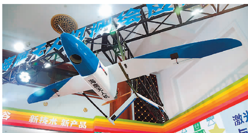
▲图为在创新创业新产品板块展出的海鹰无人机。无人机测绘是遥感领域用于地形测绘的新兴技术之一。