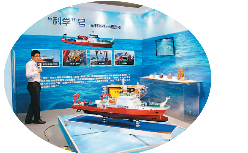
▲图为在科学重器板块，展出的科学号考察船模型，科学号海洋科学综合考察船是中国最先进的海洋科学综合考察船，具备全球航行能力，船舶和船载探测与实验系统处于国际先进水平。