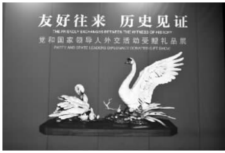
《友好往来，历史见证——党和国家领导人外交活动受赠礼品展》

每次来到国博，总是流连忘返。这里展出的中国各时期各地区各民族历史文化的宝贵遗存，凝固旧时光，穿越千百年，每一件文物，都以自己的展柜为舞台，在属于自己的聚光灯下，向观众讲述着自己的故事。而我们就凭借这一把把时光之匙靠近先人，寻找逝去的人类记忆。国博目前收藏有见证中华文明辉煌历史的珍贵文物130多万件，其中不少文物已经成为中国历史发展阶段的文化标