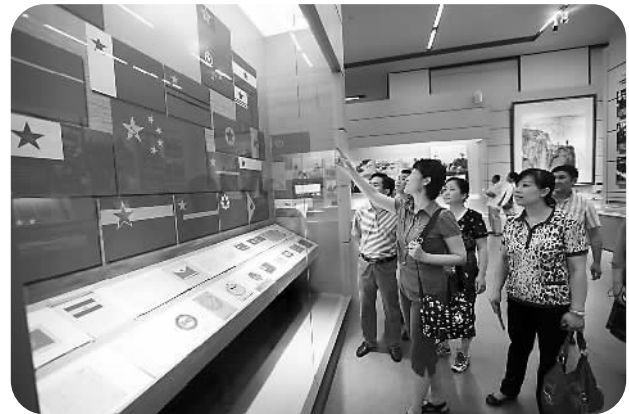
观众参观《复兴之路》展览

每次来到国博，总是流连忘返。这里展出的中国各时期各地区各民族历史文化的宝贵遗存，凝固旧时光，穿越千百年，每一件文物，都以自己的展柜为舞台，在属于自己的聚光灯下，向观众讲述着自己的故事。而我们就凭借这一把把时光之匙靠近先人，寻找逝去的人类记忆。国博目前收藏有见证中华文明辉煌历史的珍贵文物130多万件，其中不少文物已经成为中国历史发展阶段的文化标