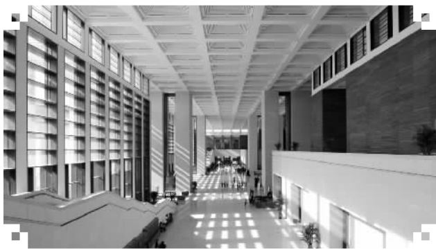
国家博物馆西大厅