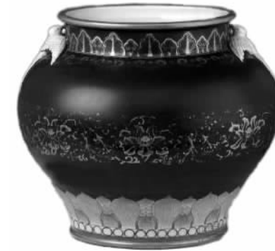
清乾隆霁蓝釉描金双燕耳瓷尊 高31.3厘米，口径25.1厘米