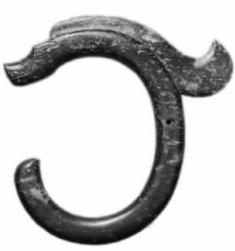
红山玉龙 通高26厘米