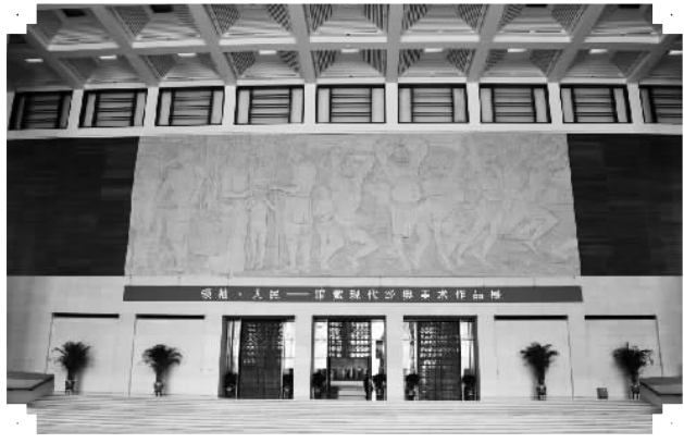
国家博物馆中央一号大厅

100多年来，从当初的筚路蓝缕到新中国成立后的百废俱兴，从劫波动荡到改革开放后的蓬勃发展，再到今天的走向辉煌，国博历史脉搏的跳动，无不与中华民族的整体命运息息相关。