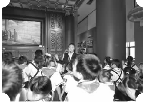
小学生在国家博物馆参观

列。《古代中国》是世界上唯一系统展示绵延不绝的中国古代灿烂文明的展览，它以2500余件古代珍贵文物为主要见证，较为全面地展示了古代中国不同历史时期，在政治、经济、文化、社会生活以及中外交流等方面的发展状况。《复兴之路》通过1200余件（套）馆藏珍贵文物和800余张图片，回顾了1840年鸦片战争以来，中国各阶层人民为实现民族复兴进行的种种探索，特别是中国共产党领导全国各族人民争取民族独立人民解放、国家富强人民幸福的光辉历程。通过《复兴之路》，我们可以重温一个古老国度从沉沦到崛起的复兴之路。