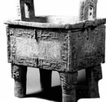
后母戊鼎 通高133厘米，长110厘米，宽78厘米，重832.84公斤