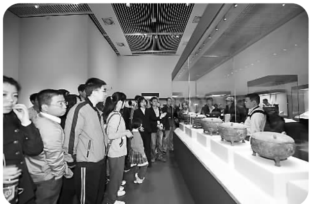
观众参观《古代中国》展览