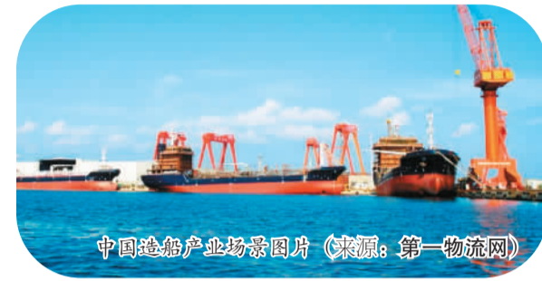
中国造船产业场景图片