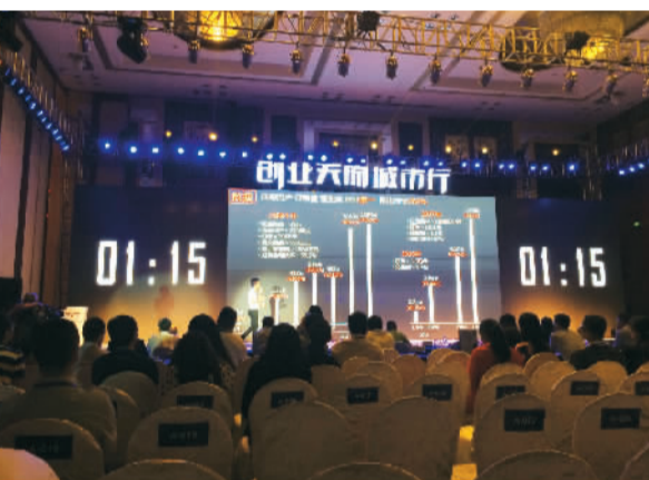
图为“创享会”现场的路演活动环节。