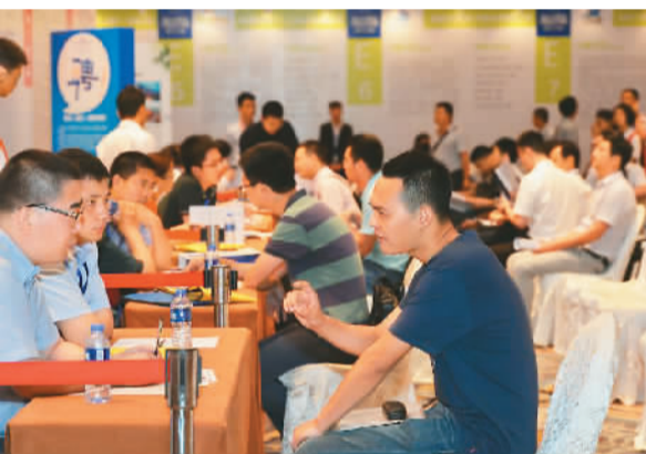
图为招聘活动现场。

品牌活动方面，将突出市场化方向。比如，以财政后补贴方式支持产业园区、高校院所、孵化器、行业协会、产业技术联盟等开展创新创业活动；举办“蓉蓉汇”韩国、以色列专场活动以及“中国·成都全球创新创业交易会”；中美、中德、中法、中韩等国际创新创业合作也将进一步推进，“一带一路”和“蓉欧+”互联互通战略将深入实施，构建创新创业的国际合作平台。