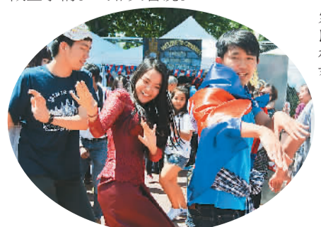
菲菲教中国学生跳柬埔寨民族舞

在柬埔寨展区前，一群身着柬埔寨传统服饰的留学生和前来参观的师生围成一个圈，伴着欢快的音乐跳起了舞。