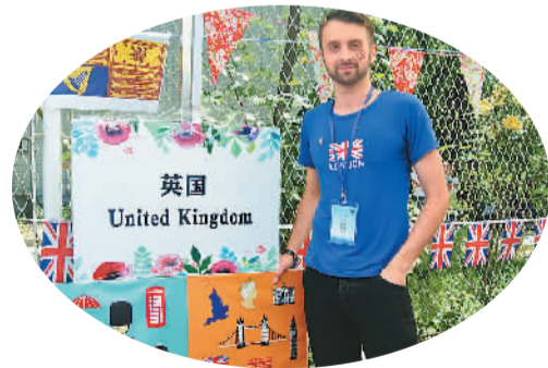
查尔斯在英国展板前

在英国展板前，一个英国小伙站在画有英国皇家卫队士兵卡通图案的展板后，在镂空处露出自己的脸，略微滑稽的模样引来路人纷纷拍照。