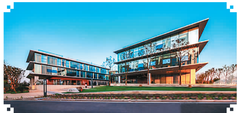
图为数据谷内的办公楼

“一周微循环生活圈”的人性化理念是仙桃数据谷的一大特色。不仅其办公楼内配套自动灌溉的屋顶花园和餐厅,阅览室、瑜伽室、台球室、健身俱乐部一应俱全,而且谷内还规划有会议及展览中心暨创新中心、多功能研讨大楼,另外还有中、小型会议室及多功能演讲厅、青年创业园等,可以满足青年创客的各种需求。