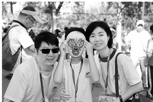
海外学人携家属参与“画脸谱知国粹”体验活动。

“海外学人长走活动”是北京海外学人中心的品牌活动,从2010年开始已连续举办7届。