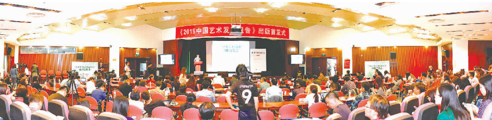
中国文联组织编写的《2015中国艺术发展报告》在京首发