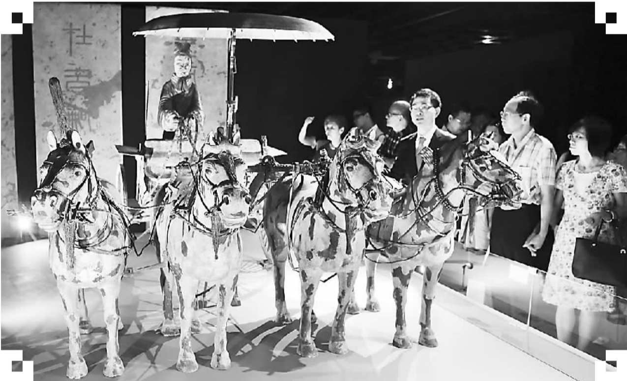
台北故宫博物院“秦·俑——秦文化与兵马俑特展”5月7日开幕。展品中一级文物占比超过七成。展出将持续至8月31日。图为参观者在观赏铜车马复制品。

台湾卫生福利主管部门则表示，已要求商家从源头减量，不要一次进货过多，同时对即期品建立管理方式，如适当促销、建立专区等，或将废弃物再利用，做成饲料或肥料。