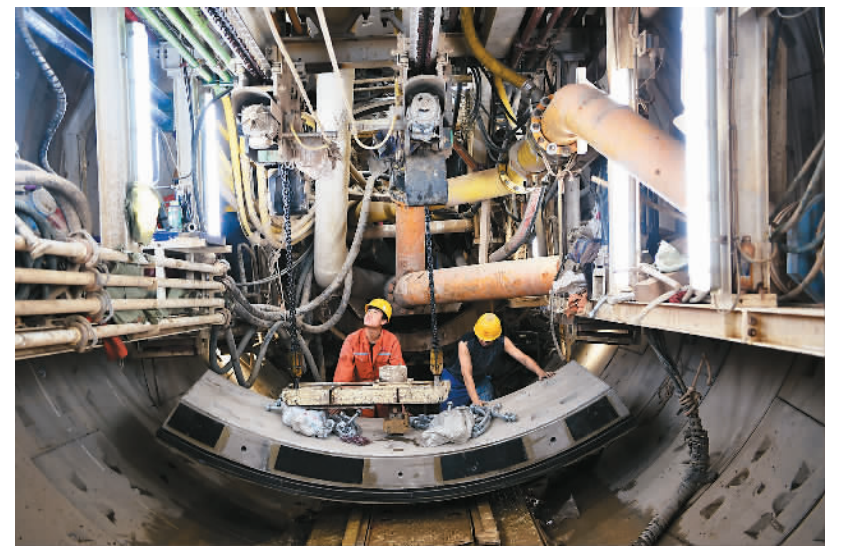
5月9日,我国首条“穿黄”地铁——兰州地铁1号线右线顺利贯通。兰州轨道交通成功穿越黄河河床、大堤等重大风险源,为年底全线贯通奠定了基础。图为施工人员准备衬砌隧道。