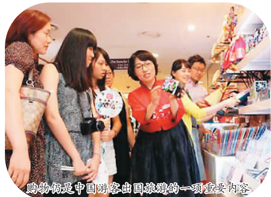
购物仍是中国游客出国旅游的一项重要内容

近日，媒体报道，法国旅游业人士也称赞，中国游客的整体形象和口碑都有所提升，更加成熟，态度友好，入乡随俗，能够融入当地生活。