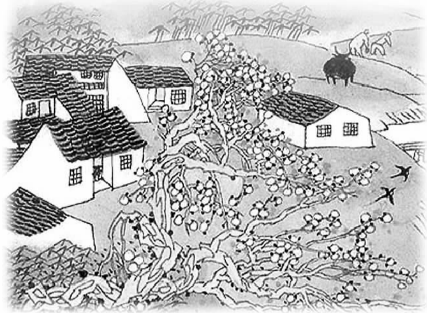
农历四月的乡村景致