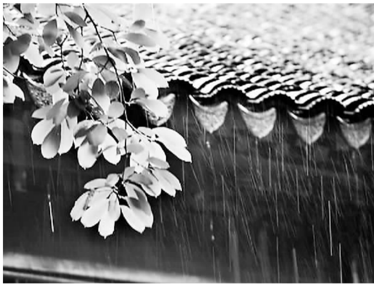
农历四月，梅雨来临

旧时，农家还以此日风向占谷价。谣曰：“南风吹佛面，有收也不贱；北风吹佛面，无收也不贵。”