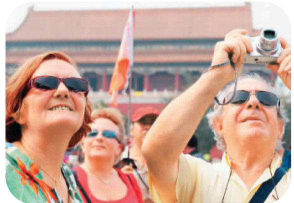
外国游客在天安门

张凌云同时指出,外国人来华旅游的下行趋势,还受到近年国内旅游发展的影响。“国内旅游的兴起对外国入境旅游有着挤出效应。”没有了创汇驱动,接待国内游客同样能收到良好的经济收益,旅游经营者也