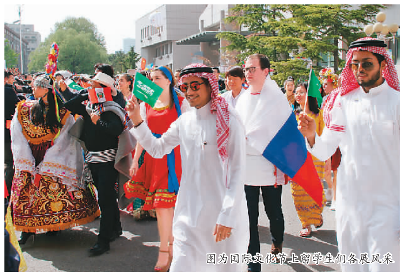
图为国际文化节上留学生们各展风采

“虽然中泰两国一衣带水，但是具有各自的风俗习惯与特色。刚来中国时，我不了解中国文化，语言也不通。有一次，我和几个朋友一起去吃饭。点餐时我跟服务员说‘馒头全部炸’，而服务员却认为是‘馒头全不炸’。后来跟服务员解释了半天，他才明白我的意思，又给我们重新做了一份。现在在我的中文水平提高了不少，基本的生活交流也没问题了。在