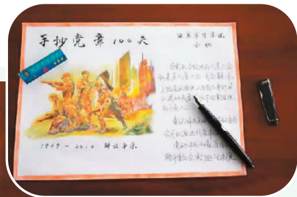
▲▲图为来自陆军军官学院网友的手抄党章作品