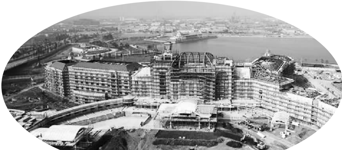
上海迪士尼乐园酒店在启动地上建设仅12个月之后,于近日顺利封顶。