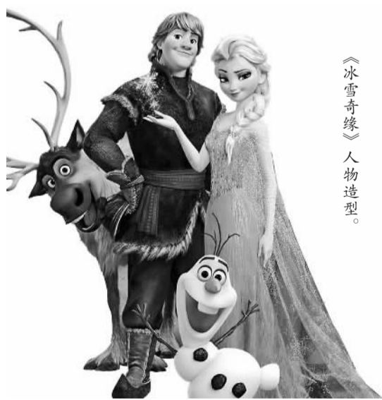
《冰雪奇缘》人物造型。

2016年3月28日,上海迪士尼乐园门票开售,正式吹响上海迪士尼开业的号角。这一中国迄今规模最大的现代服务业中外合作项目之一,正通过自己的一步实践,走向令人期待的明天。