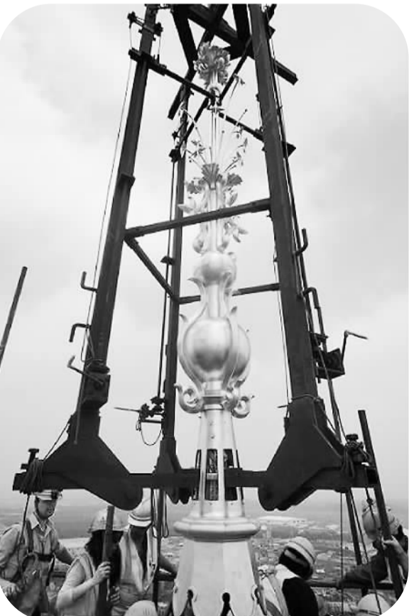
独特中国元素登顶迪士尼最大城堡的标志性尖顶。

一直以来,上海迪士尼乐园的承建者们都以自己扎实高效的建造速度为豪,可是很快他们就发现,美方不是不需要速度,但绝不会为了速度牺牲任何一个微小的细节。美方工作人员对工程建设的较真劲儿,甚至让不少颇具经验的中国