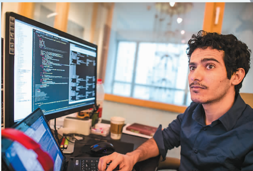
来自也门的阿德是一名程序员，他来到中国留学后，选择留在北京创业，成为一名“洋创客”。

从事硬件创业的他发现，深圳有着完整的电子产业链、低廉的人力和设备成本，资源更是大都集中在方圆几十公里内，这些条件让创业变得简单。