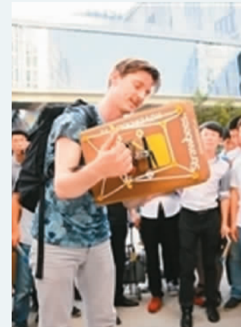
外国创客带着自己的发明，来到深圳创客周。(资料图片)

代表最新潮流的外国创客愿意到中国来，已经显示出中国相对于老牌发达国家的竞争优势。接下来中国要做的就是，创造更好更公平的竞争环境、更宽松的创新环境、更优质更人性化的人才引进政策，让外国人才愿意来、来了能干事儿、来了不愿走。这样，才会“桃李不言，下自成蹊”。