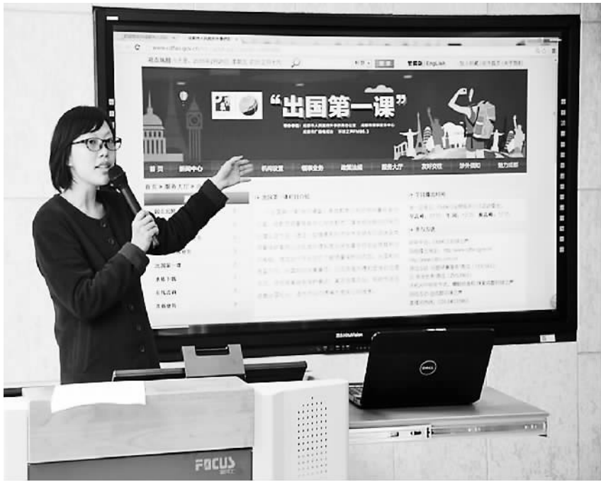
今年2月26日，成都市侨办和教育局等推出的领事保护公益讲座“出国第一课”走进成都市棕北中学。