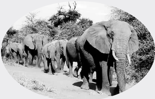
图为肯尼亚动物大迁徙

咬鼻子是肯尼亚安群岛年轻人的求爱方式。姑娘看中某个小伙子，会趁他上街时，出其不意地朝他鼻梁猛咬一口。如小伙不顾流血疼痛，向姑娘微笑着，求婚就算成功了。如不同意，亦可不笑，但需向对方赔偿“礼节费”。