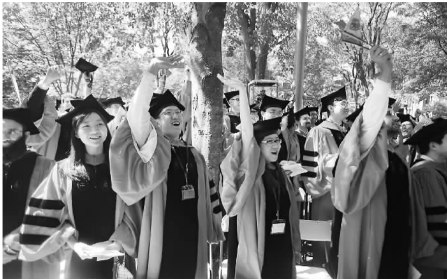
图为哈佛大学的亚裔学生

因此，针对今年大多数常春藤盟校录取亚裔生比率又创新高的现象，一些人联想到是不是之前的抗议奏效了？有华裔人士认为：“对这种歧视行为的行政申诉或法律诉讼，会迫使这些学校对他们的歧视行为进行检讨和自我约束，从而会增加对亚裔生的录取比率”。参与了之前64个亚裔团体联合维