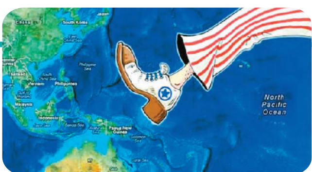
图为美国搅局南海漫画。