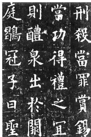
欧阳询《九成宫醴泉铭》(唐)拓本 原石现存陕西麟游县