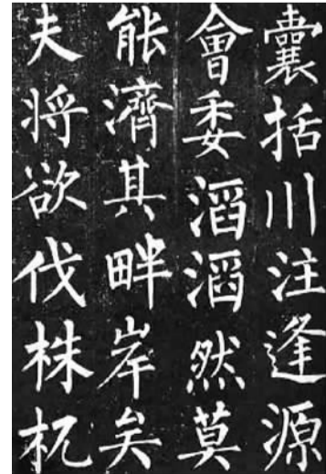
柳公权《玄秘塔碑》(唐)拓本 原石现存西安碑林