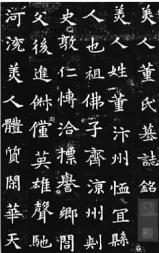
《董美人墓志》(隋)拓本 日本三井文库藏