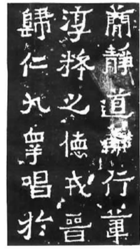
《爨宝子碑》(东晋)拓本 原石现存云南曲靖市一中