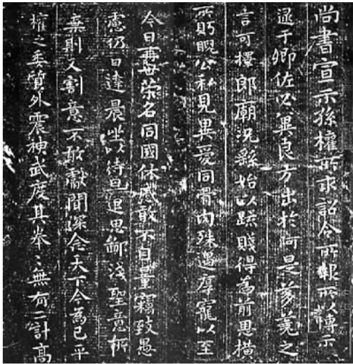
钟繇《宣示表》(三国)刻本 故宫博物院藏

楷书作为一种标准字体沿用了1800年左右。就其种类而言，分为小楷、中楷、大楷及榜书；就其演变而言，经历了隶楷、晋楷、魏楷、唐楷4个时期，分别标志着楷书的萌芽、成熟、发展和鼎盛。