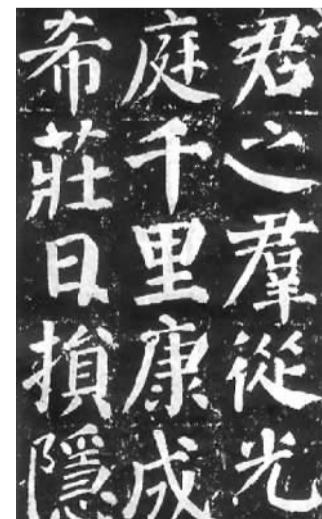
颜真卿《颜勤礼碑》(唐)拓本 原石现存西安碑林