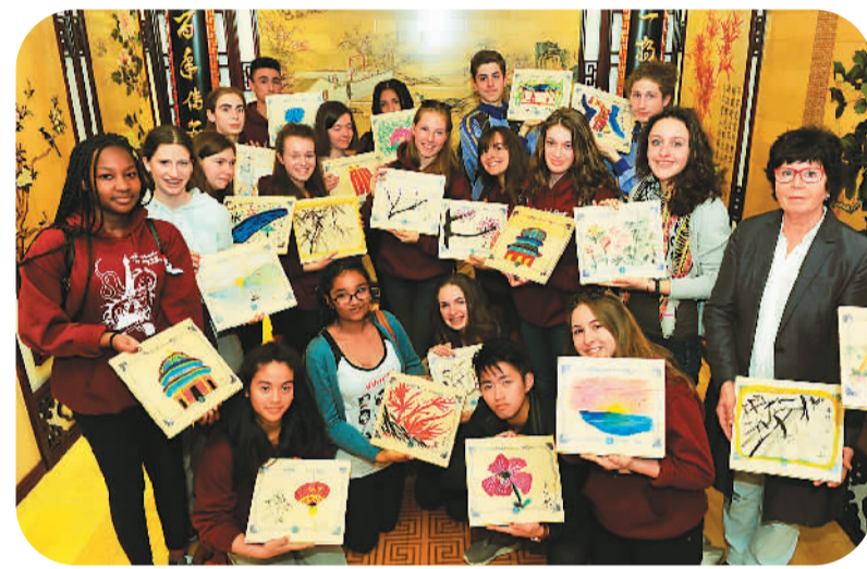
4月18日,来自法国梵谷高中和德卡高中的师生来到石家庄百年巧匠木绘坊,参观和体验手工艺“木绘拼花”,了解中国的传统文化。“木绘拼花”是以木板为载体,将“嵌、烙、刻、绘”四种古老的技术相结合的手工艺。图为法国中学生在展示自己创作的作品。