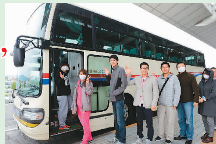
图为中国留学生登上福冈总领馆租用的巴士离开灾区前往乘坐新干线。

除积极开展救援外,领馆还充分调动和协调当地留学生、华侨华人团体,组织学生自救互救。