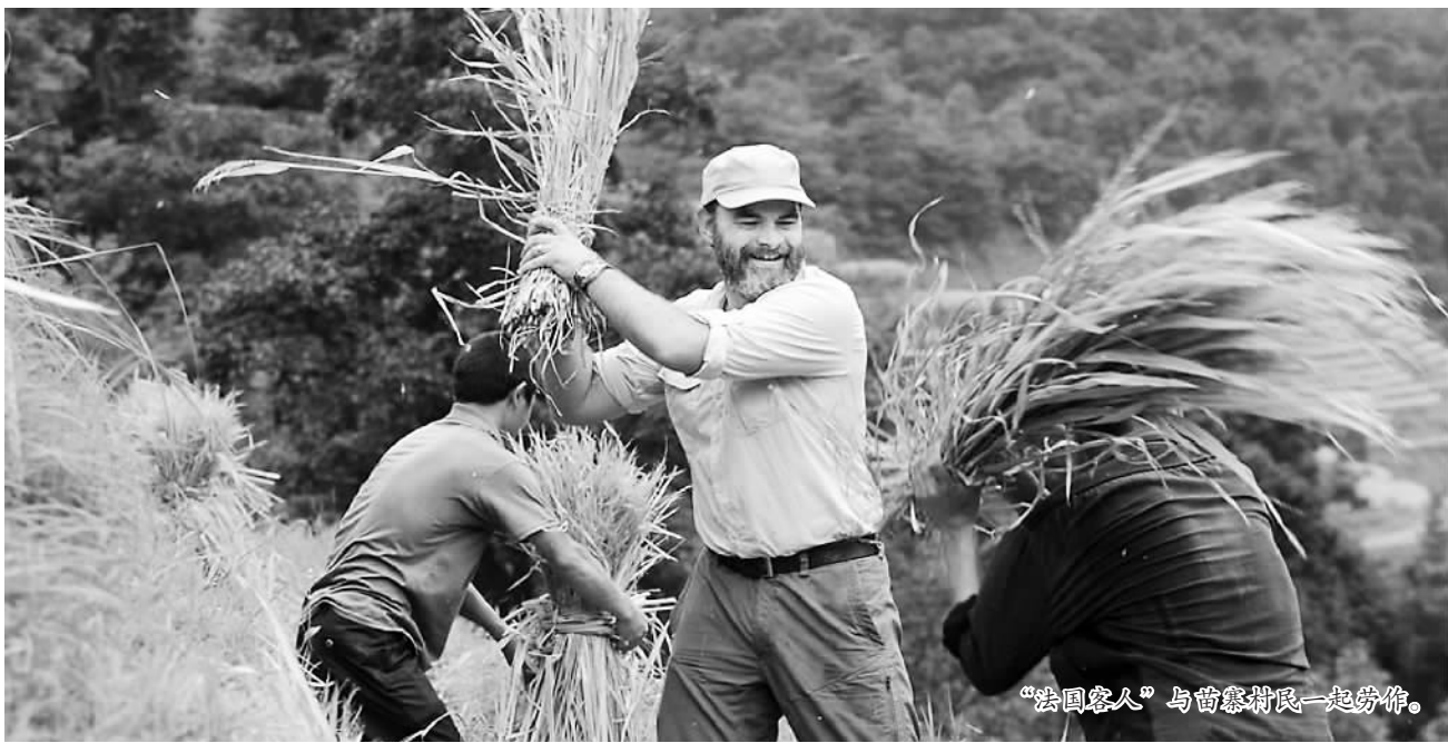
“法国客人”与苗寨村民一起劳作。