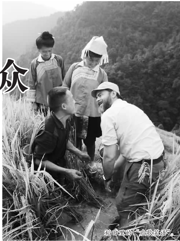
稻田里的“欢聚晚餐”。

重视给出了方向——尽管孩子们要徒步3小时才能到学校,每周只能回一次家,但他们坚信:只有接受教育,才能有出息。