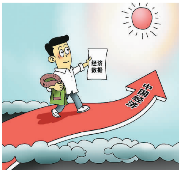
朱慧卿作

本报北京4月15日电 (记者陆娅楠、李丽辉) 国家统计局15日发布数据,初步核算,2016年一季度国内生产总值(GDP)158526亿元,按可比价格计算,同比增长6.7%。 “经济运行延续了稳中有进的发展态势,结构调整深入推进,新兴动能加快积聚,一些主要指标出现积极变化,国民经济开局良好。”国家统计局新闻发言人盛来运说。