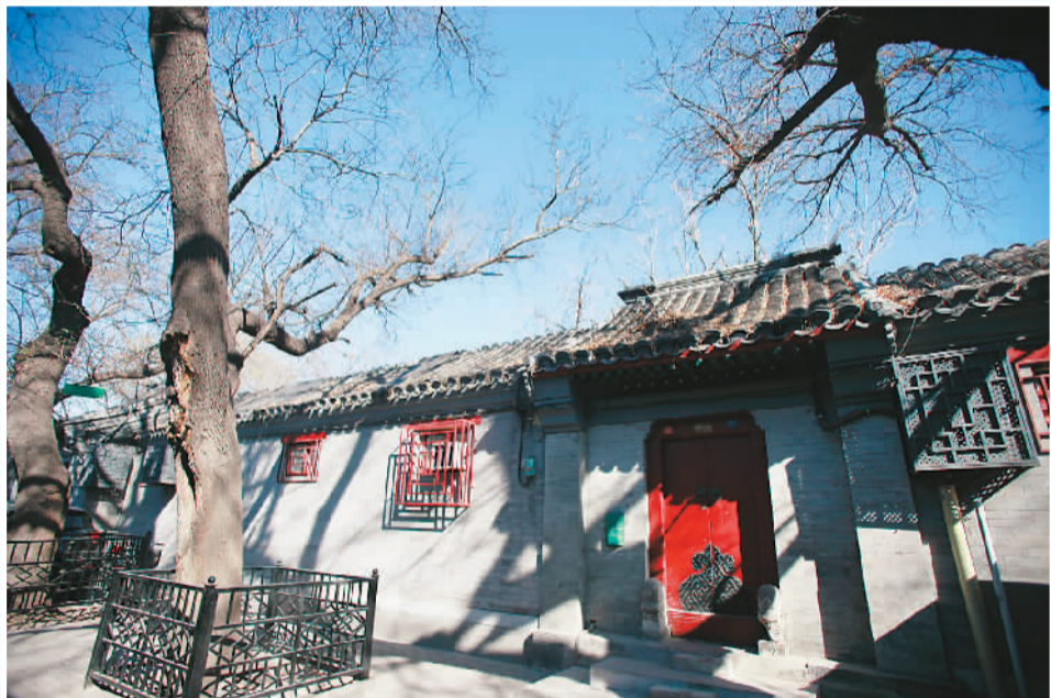
▲ 北京四合院始终是外国游客寻找北京旧时光的宝地。图为北海附近一处胡同内的四合院外景。