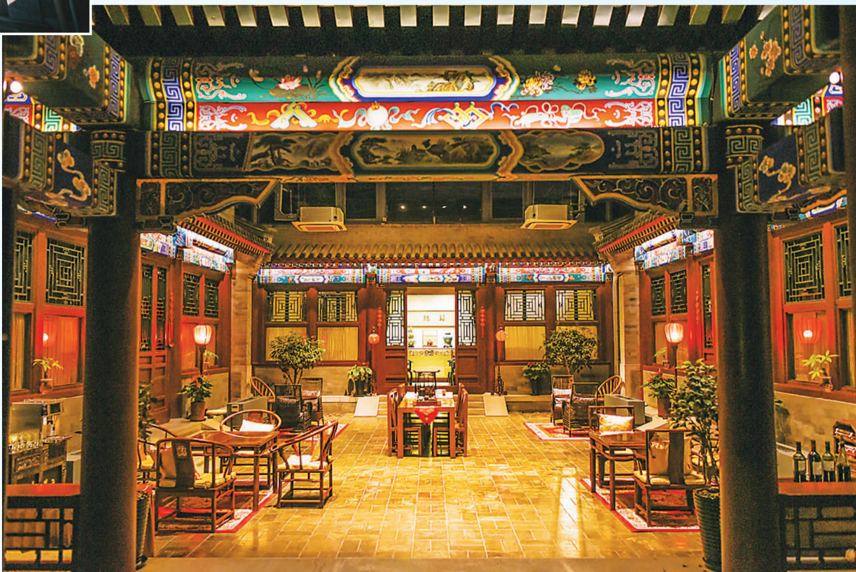
▲ 北京市西城区德内大街兴华胡同内的四合院庭院景致。