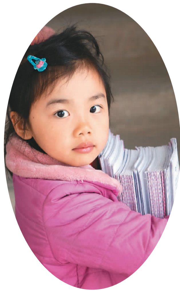
▲一名留守儿童怀抱书本