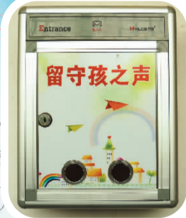
▲供留守儿童倾诉心声的信箱