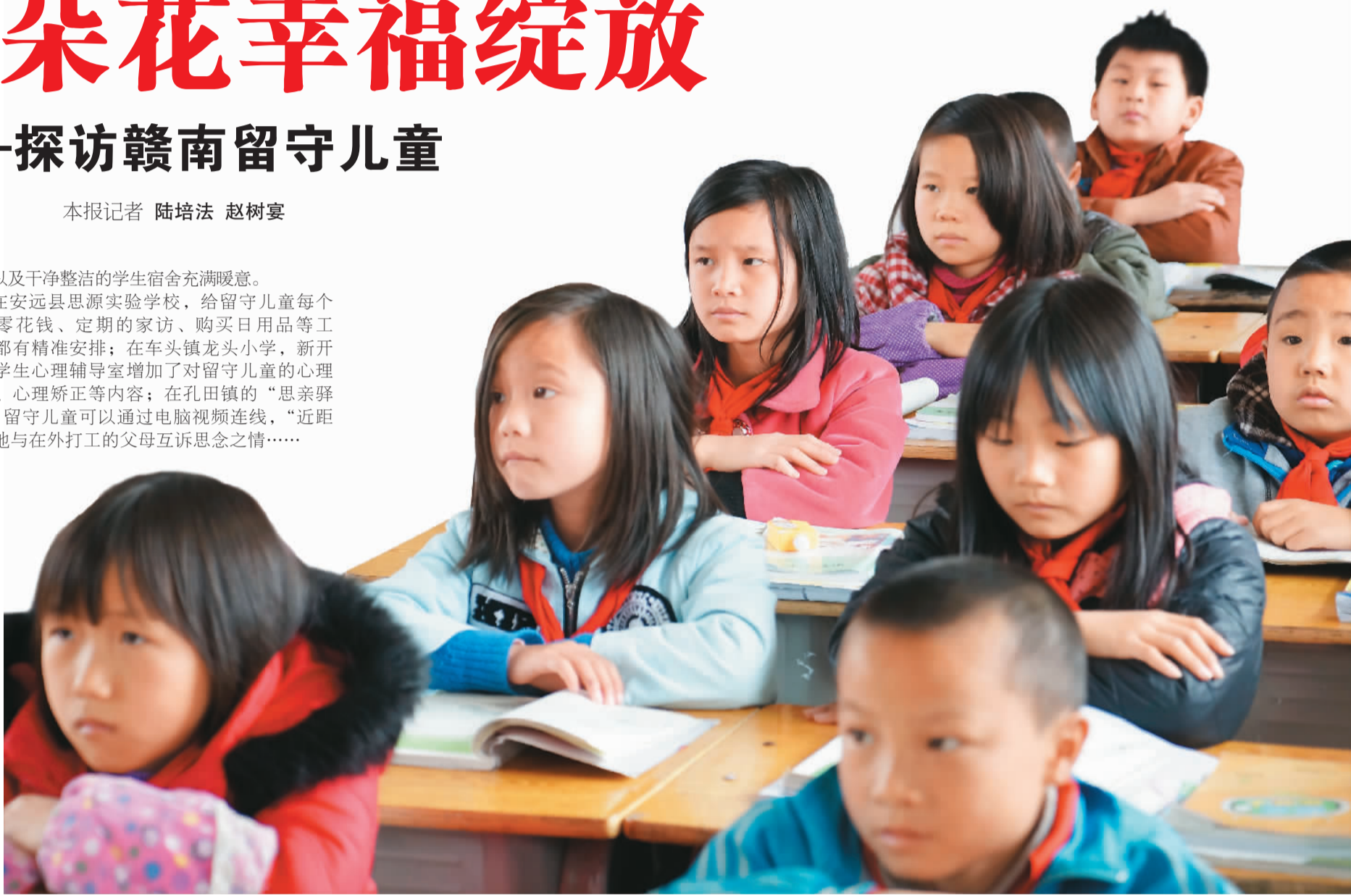
龙头小学的孩子在课堂认真听讲